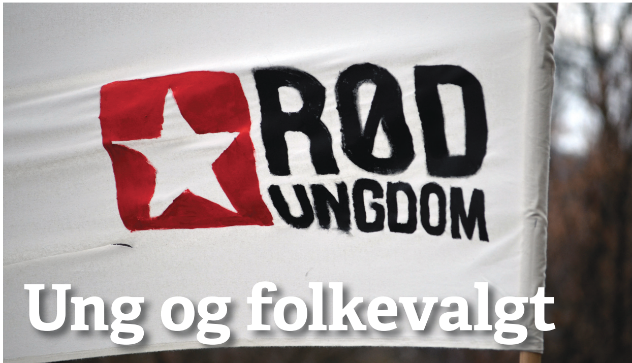
Rød Ungdom: Flere RU-medlemmer har blitt folkevalgte etter høstens valg.