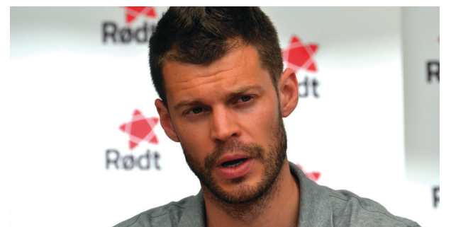
Frikjent: Rødt-leder Bjørnar Moxnes.

– Det var i alle fall godt å få bekreftet at vi ikke har gjort noe ulovlig. Det var også gledelig å se at både VG og Aftenposten støttet oss på lederplass.