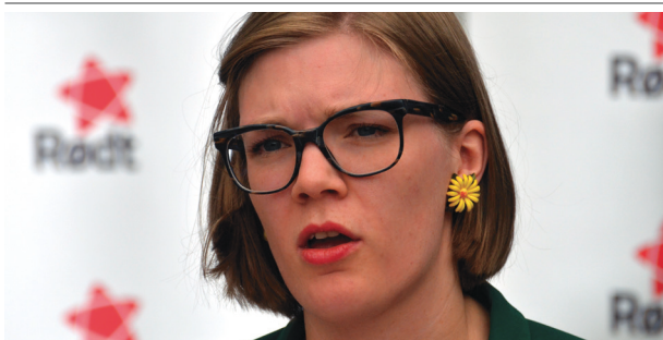
Nestleder i Rødt: Marie Sneve Martinussen.