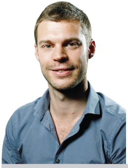
Bjørnar Moxnes b.moxnes@roedt.no Leder i Rødt