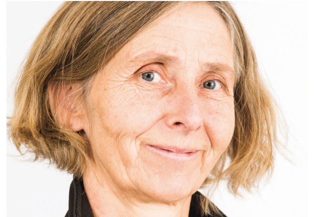
Midtøsten-rådgiver: Trude Falck.

– Norge bærer sin del av ansvaret for verden slik den ser ut i dag, etter 14 år med såkalt krig mot terror. Ødeleggelsen av statene i Afghanistan,