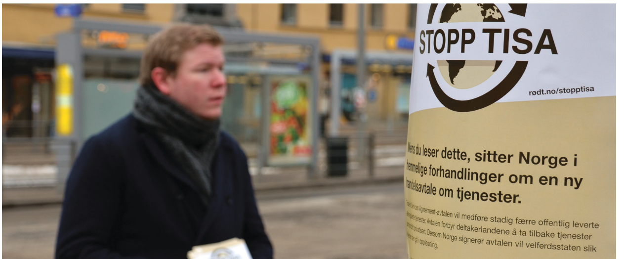
TISA: Trugar den norske velferdsstaten.